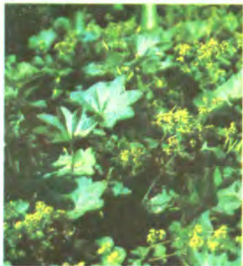
33. Приворотень стрункий